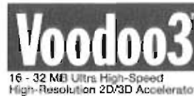
Voodoo 3 ASUS