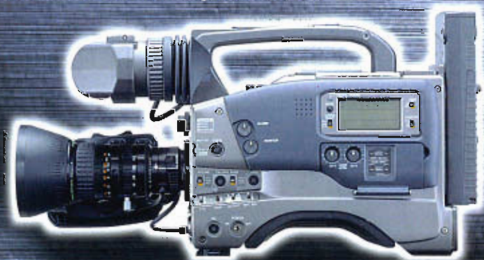
DV CAMCORDER GY-DV500 Mini DV

PROFESSIONAL DV de JVC: preparado para atender las demandas de los profesionales.