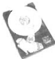
MDD ultra DMD 6b