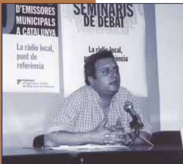
SEMINARI DE DEBAT SOBRE INFORMATIUS

La Federació de Ràdios Locals té previst organitzar altres Seminaris de Debat sobre publicitat, sobre l'adaptació musical a les emissores municipal; en definitiva, sobre totes les problemàtiques que afecten a la programació de les ràdios locals.