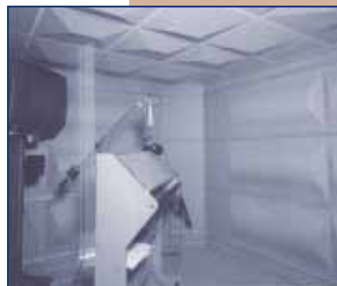
ESTUDI DE DOBLATGE