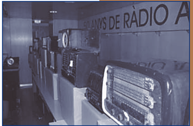
MOSTRA D'APARELLS ANTICS DE RÀDIO

Avui, després de 50 anys d'alts i baixos, Ràdio Ona és un dels centres neuràlgics d'informació de la Vall del Ges i un espai de reflexió i opinió, per on passen cada setmana una mitjana de 60 persones.