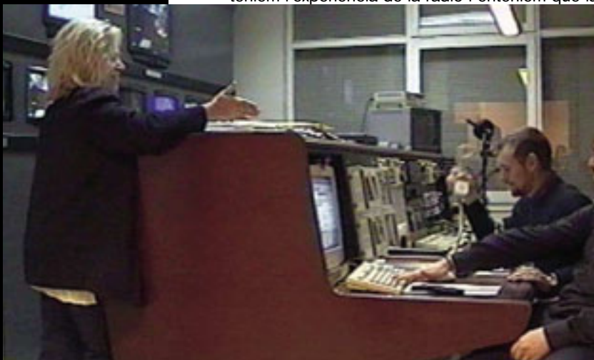
Sala de realització de la Televisió de Blanes.

ació d'àmbit local: la producció pròpia. Fem un informatiu diari de producció pròpia, amb tot l'esforç que això representa i, a més a més, tenim tota una sèrie de produccions especials que fem al llarg de l'any, des de l'emissió dels plenaris municipals fins a la retransmissió de conferències o altres actes sobre temàtiques varies. D'altra banda, des de fa dos anys, els dilluns fem un programa d'esports en directe, d'una hora de durada. En el conjunt de la setmana emetem unes 12 o 13 hores de programació pròpia. La resta de la graella l'acabem d'omplir amb la programació de suport que ens arriba a través del Consorci. La voluntat és augmentar, dins de les nostres possibilitats, la programació local, tocant de peus a terra i ajustant-nos al pressupost.