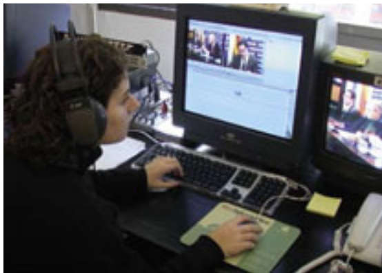
esta centralitzada a l'area de Barcelona, ben Una redactora editant una de les notícies que posteriorment es distribuiran a les televisions de la Xarxa.

La Xarxa de Televisions Locals (XTVL) del Consorci Local i Comarcal de Comunicació (CLCC) amplia l'oferta de programació via satèl·lit amb la incorporació d'un servei de notícies audiovisuals. En una primera fase, el servei s'està oferint amb un lliurament al dia, en concret a les 19.00h, però ben aviat s'ampliarà a dos serveis diaris. Aquest segon lliurament serà a les 13 h.